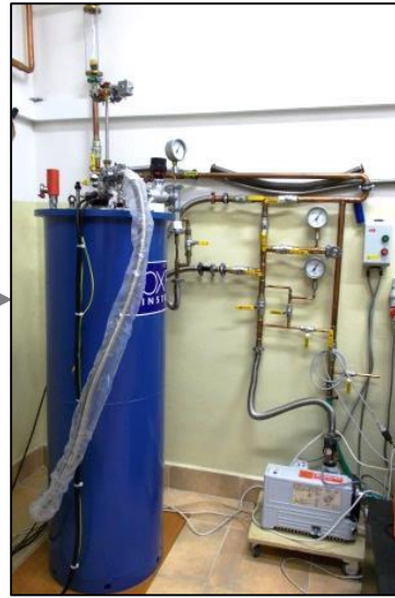
液体ヘリウムの蒸発 真空ポンプによる減圧