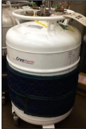
液体ヘリウムの運搬 液体ヘリウムの保管